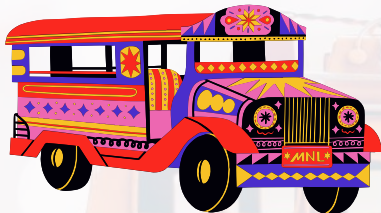
格安移動手段 ジブニー

ジブニーやバイクタクシーなどもポピュラーな移動手段です。特にジブニーは、カラフルなカラーリングが特徴で、初乗りが20円程度から乗車することが可能です。