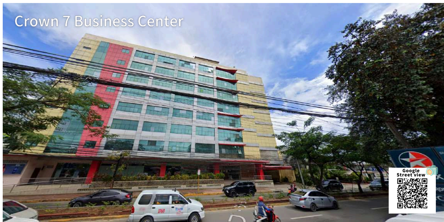
Crown 7 Business Center